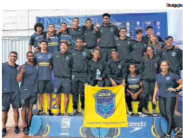
A ABDA participou com 18 atletas e três técnicos

"Este Campeonato Paulista foi atípico esse ano, pois foi realizado no meio do semestre