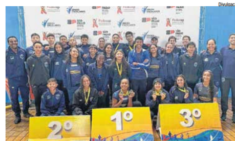
Foram 5 medalhas de ouro, 7 de prata e 5 de bronze nas provas de natação