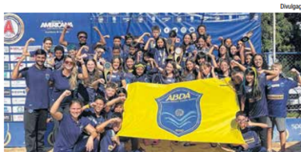
Petiz 1 feminino foi 1º lugar, petiz 1 masculino 4º e petiz 2 feminino ficaram em 4º e petiz 2 masculino em 2º

A comissão técnica, composta pelo professor Max e pelas professoras Monique Matunaga