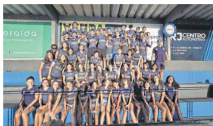
O torneio regional ocorreu em Marília no último sábado

Esses campeonatos serão os principais desafios do time ABDA. Por isso, os torneios regionais são importantes para a preparação dos atletas mais